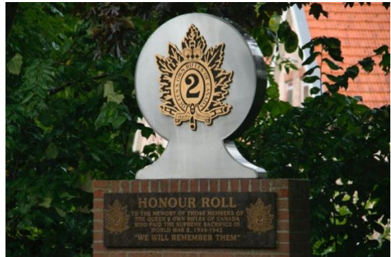
Kranslegging bij het monument ter ere van de gevallen van de QOR te Wons