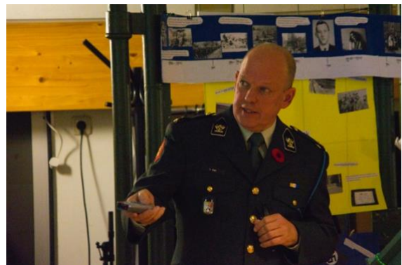
lezing door voorzitter van de KVNRO-afdeling Friesland