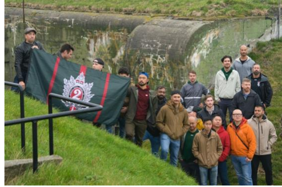
QOR op bezoek in Kazematten Museum te Kornwerderzand