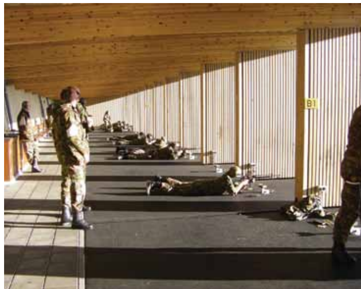
Het was mooi schietweer.

Om in de tussentijdse perioden de benodigde rust en ontspanning te kunnen vinden, was centraal achter de NH-banen een boogtent opgebouwd alwaar men zich kon verpozen en waar men de inwendige mens kon versterken door gebruik te maken van de diensten van, laat ik het gemakshalve nog maar zo noemen, de 'CaDi' wagen maar ook te genieten van de opgevoerde LuPa's, v.v. broodje worst, koffie, thee en andere zaken. Al deze elementen bij elkaar zorgden ervoor dat in een plezierige ambiance oude contacten aangehaald en nieuwe contacten opgedaan konden worden.