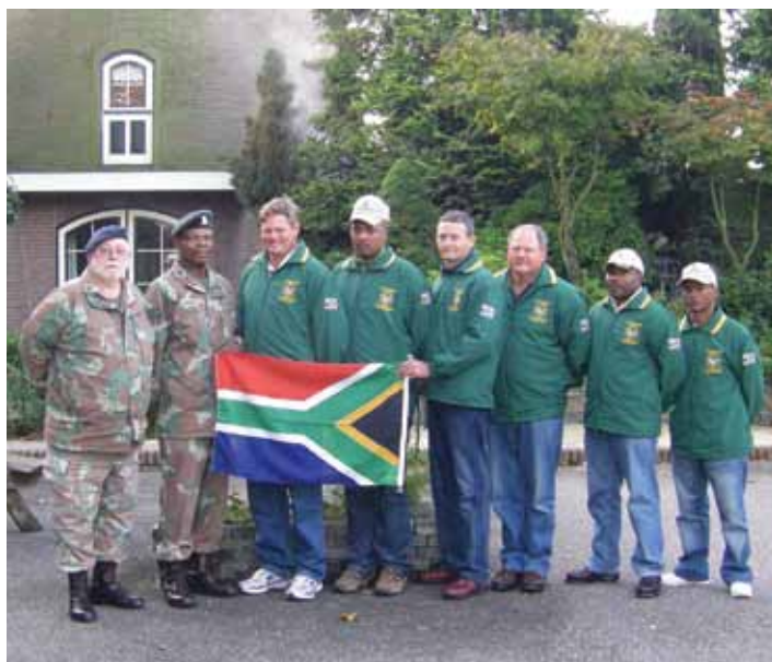
Zuidafrikanen in Hollandse setting

In deze tijd van het jaar blijft het in de vroege ochtend altijd spannend hoe het zicht op de schietpunten zal zijn. Hoewel het nagenoeg windstil is, blijkt de mist op de FAL en Diemaco banen zover teruggetrokken dat het 200 mtr punt goed zichtbaar is. Aldus wordt besloten dat het speciale 'mist programma' ("FOG-programme") niet geactiveerd hoeft te worden. Het belooft een prachtige dag te worden.