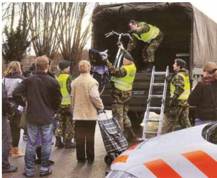
Itteren en Borgharen

Daarom heeft ook op dat niveau een wijziging plaatsgevonden. In april 2010 heeft het kabinet besloten tot de instelling van de Landelijk Operationele Staf (LOS 2 ) waarmee het LOCC opgeschaald kan worden. Het is vergelijkbaar met een mobilisabele staf.