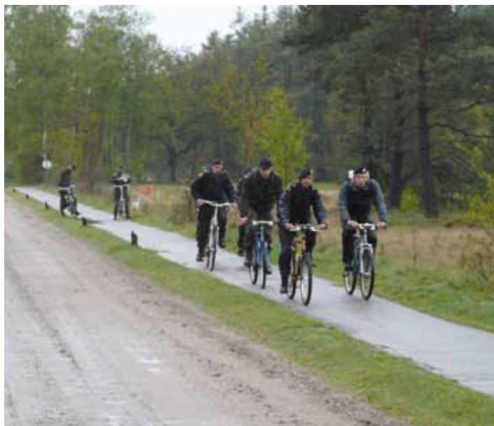
Op de fiets

lijke 25 km voor senioren en 20 km voor veteranen. Bij het schieten op de nieuwe geweerbaan werd een verbeterde doorstroomprocedure met succes toegepast.