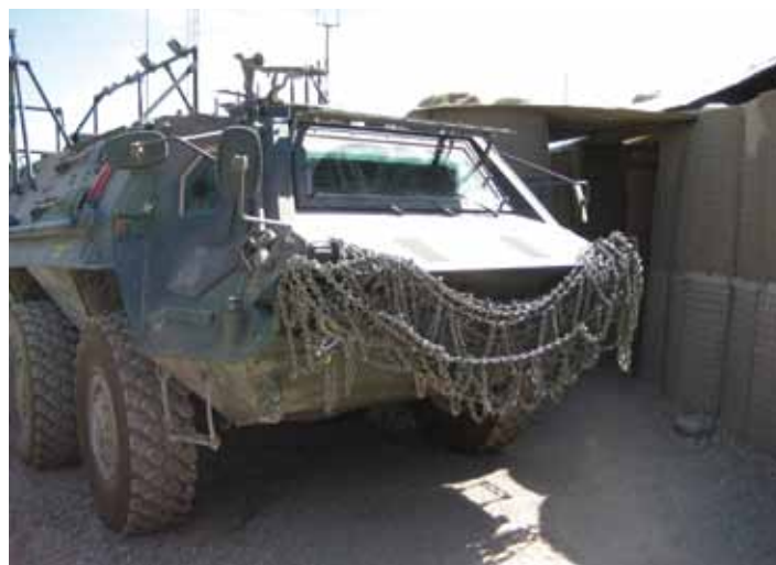
Fuchs pantserwagen met sneeuwkettingen bij 40 graden Celsius

Voorafgaande aan dat buffet dus eerst die 7 toespraken met een totale tijdsduur van anderhalf uur, terwijl de cursisten dus in de brandende zon stonden. Maar wat waren ze trots! De beste leerlingen van elk van de vier klassen kreeg zijn diploma uit handen van een bobo en draaide zich vervolgens triomfantelijk om naar zijn maten en kreeg een ovatie van alle aanwezigen terwijl hij vol trots het diploma omhoog hield. En eerlijk is eerlijk, voor het armzalige clubje dat ik 8 weken tevoren mee heb helpen inprocessen hadden ze best een hele grote prestatie geleverd. Ze hadden zich in deze periode toch een aantal basisbeginselen van discipline eigen gemaakt, ze konden exerceren, ze hadden inmiddels allemaal het juiste uniform gekregen en hadden ook naast hun politietrainingen vaak in de avonduren een (vrijwillige) alfabetiseringscursus gevolgd. 95% van hen was namelijk analfabeet toen ze aankwamen. Da's niet handig als je een proces verbaal moet schrijven... omdat anders je arrestant binnen een paar dagen weer vrij rondloopt. Kortom, ook hier was weer een stukje vooruitgang gerealiseerd. Eens lukt het om Uruzgan te ontworstelen aan de Middeleeuwen waarin het zich al sinds mensenheugenis bevindt.