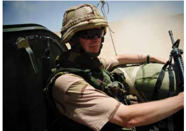
Als MAG-schutter achterop een Bushmaster!