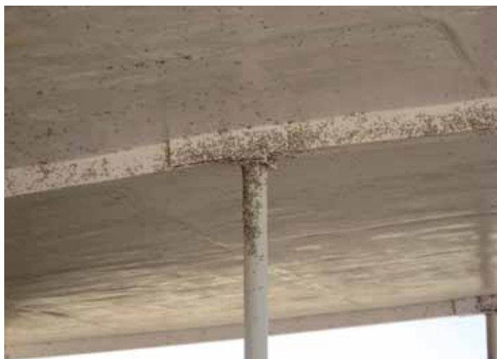
vliegenshura tijdens opening PTC

zoals onze majoor Edwin onlangs in de media liet quoten: "Ze hebben natuurlijk nog niet helemaal het Nederlandse niveau." Deze ANCOP-ers hadden pech: drie dagen voordat ze weer werden afgelost, is een van hun voertuigen op een IED gereden, met een dode en drie zwaar gewonden tot gevolg. Tot zover alles "Insh Allah", ware het niet dat ze zelf in staat bleken een van de vermoedelijke leggers van de bom te arresteren. De ongelukkige werd meegenomen naar de politiepost, alwaar hij niet helemaal onbeschadigd aankwam. Er zitten hier soms echt hele diepe kuilen in de weg! De politiepost zat dichtbij de ANA-post waar ook een Nederlands team aanwezig was. De gemoederen liepen nogal hoog op want ook de ANA- bemoeide zich ermee en op enig moment werd betrokkene "schuldig verklaard" waarna er een executie dreigde. Niet gewoon met een geweer, maar met RPG (Roc- ket Propelled Grenade). Er zou bij het op deze wijze voltrekken van het "vonnis" van die man waarschijnlijk niets meer teruggevonden zijn. Het Nederlandse team is toen letterlijk tussen beiden gesprongen en heeft kans gezien de bewaking van de man over te nemen en hem vervolgens op een heli naar TK te zetten. Kortom, Overste Gijs, het laagje "Rule of Law" is nog steeds flinterdun, zeker als er eigen mensen worden gedood en ook bij de overigens van veel zijden terecht gerespecteerde ANA's.