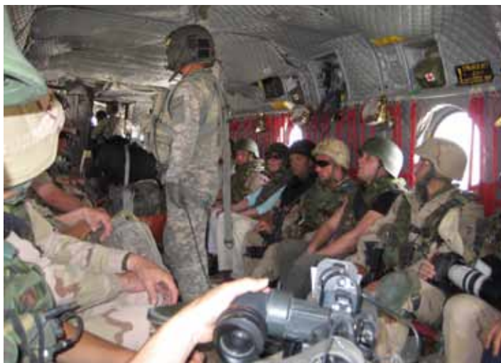
Met de camera van het Jeugdjournaal in de hand ook nog een foto gemaakt; Multi-tasking]