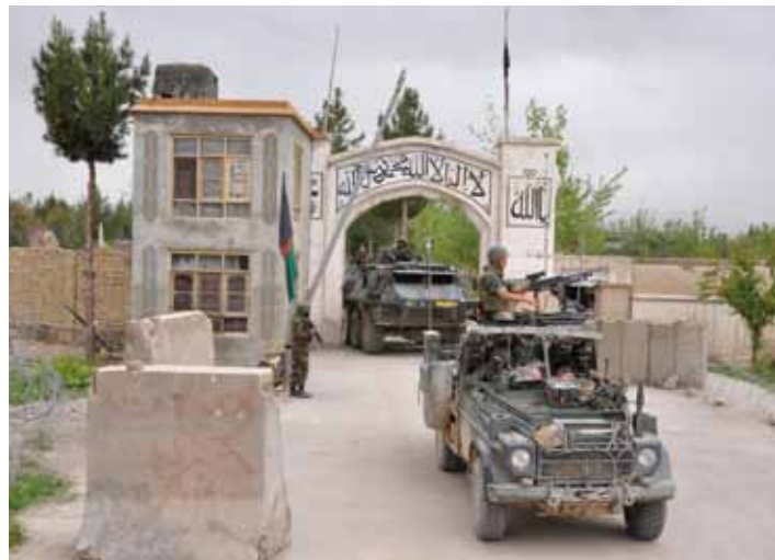
Het verlaten van de Governor's Compound

was. Later bleek dat een Afghaan een schotwond aan zijn been had, zonder dat wij er bij betrokken waren. Het kan dus een ongelukje geweest zijn, maar ook een onderlinge rekening die is vereffend en waarvan wij dan de gevolgen mogen verhelpen. Bedenk hierbij dat in het verleden het meermalen is gebeurd dat ernstig gewonde Taliban netjes per pick-up op het kamp werden afgeleverd om door ons behandeld te worden. Hoewel ik de eed van Hypocrates niet ter discussie wil stellen, is dat toch wel een beetje vreemd... Maar goed, gelukkig geen collega die iets ernstigs was overkomen.