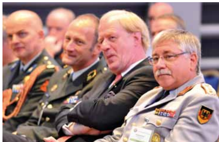
Het publiek luistert vol interesse