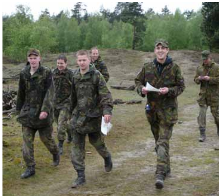
Vol goede moed

Het is vrij simpel uitvoerbaar: gewoon de link van de betreffende internet pagina als 'discussie' in de groep publiceren,