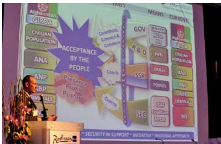
generaal-majoor De Kruijf spreekt het congres toe.

Ter afsluiting een quote over zijn ervaring met reservisten van de plv bevelhebber KL, gen-maj. Mart de Kruijf: "increased richness in the military command structure by involving reservist's intellectual capacities and experiences"