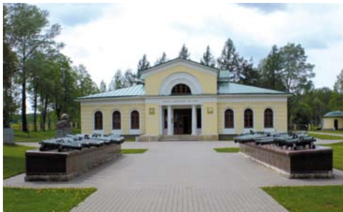
Museum in Borodino

Na het verlaten van het gehucht waar het station zich bevindt, ontrolt zich voor het oog een lieflijk, zacht glooiend weideland, doorsneden door beekjes. De heuvels worden geflankeerd door bospercelen van berken en dennen. Op de open velden is hier en daar een los bosje te zien. Het geurt heerlijk naar zomer. Overal staan bloemen kleurig in bloei en in de verte glimmen de gouden koepels van een vrouwenklooster. Borodino moet er op 7 september 1812 ook ongeveer zo uitgezien hebben. Alleen stonden er toen, aan de vooravond van de grootste eendaagse veldslag tijdens Napoleons veldtocht naar Rusland, tientallen tot de tanden gewapende Russische en Franse divisies en brigades tegenover elkaar. Daaraan herinneren nu nog de tientallen monumenten en gedenksteden van de eenheden van het Russische Imperiale Leger van Tsaar Alexander I. De slag eindigde onbeslist, maar was wel het signaal dat de Fransen verslagen konden worden en hij betekende het einde van de Franse opmars in Rusland. Napoleon zei er volgens de overlevering het volgende over: de slag bij Borodino was de mooiste en de ergste die ik meemaakte, de Fransen toonden zich een overwinning waardig, maar de Russen hebben het verdiend niet overwonnen te zijn.