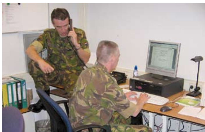
Het actiecentrum in vol bedrijf.

Het scenario en de details van de opdrachten blijven tot het moment van de vaardigheidstesten vanzelfsprekend geheim.