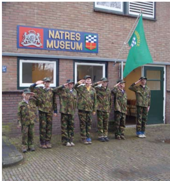
Kinderen actief in het museum

Openingstijden van 1 april t/m 31 december zijn van 13:00 tot 16:00 uur en de toegang is vrij! Meer informatie over bereikbaarheid en openingsdagen en tijden kunt u vinden via www.natres.net . U kunt natuurlijk ook bellen met het NATRES-museum via tel nr. 0318-454492.