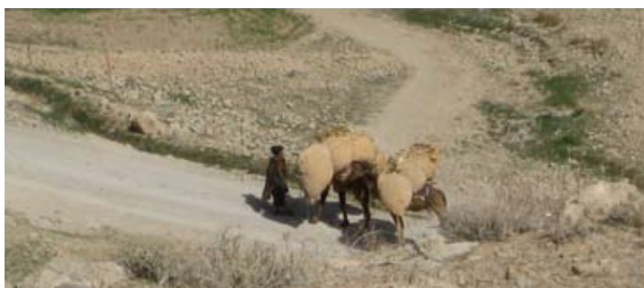
Soms waan je je in het Oude Testament. Een mini-karavaan met kamelen bij PB Qudus

De omgeving was absoluut het bekijken waard. We hadden een goed overzicht over de Green of Groene Zone. Dat is in feite de rivierbedding met uiterwaarden, want alleen daar is met behulp van een eeuwenoud irrigatiesysteem landbouw mogelijk. De rest bestaat uit zand en rots. Maar in de Green stonden alle bomen in bloei. De bloesem was prachtig om te zien en overal zag je boeren op het land werken. Het was een vredig tafereel en moeilijk voor te stellen dat in dit gebied recentelijk flink gevochten was. Maar in december is op deze post nog een Australische sergeant gesneuveld, getroffen door de gevolgen van een inkomende 107mm raket, die afgevuurd was vanaf een zandformatie 2 km verderop. Die formatie werd de Sphinx genoemd, een naam die treffend gekozen is. Ook de Sphinx was mooi om te zien, maar met de gedachte aan deze sergeant krijgt die schoonheid toch een macabere schaduw. Het bizarre van dit land is dat de mensen vriendelijk zijn, het landschap door zijn ruigheid van bijna ongeëvenaarde schoonheid is, maar dat het gevaar overal loert als je je waakzaamheid even laat verslapen.