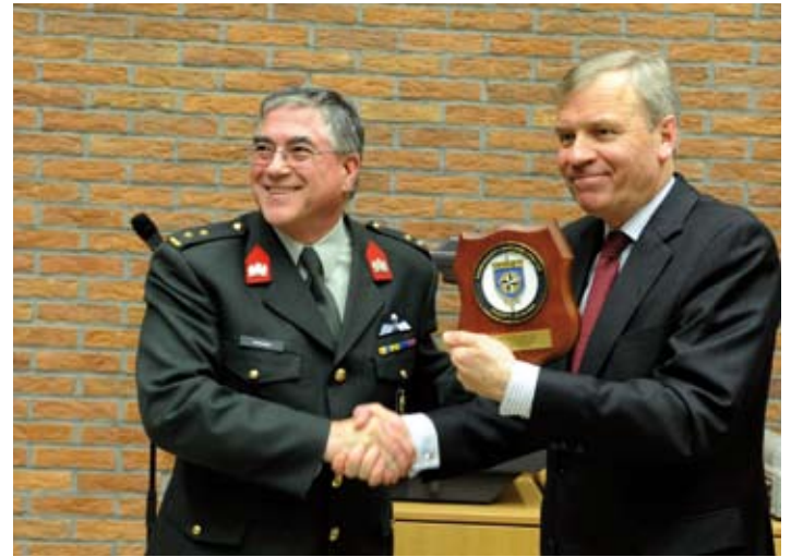
Lkol Willem Verheijen dankt namens CIOR de NAVO SG Jaap de Hoop Scheffer

between the two requirements and develop the forces and capabilities that have the flexibility and adaptability to operate across the full spectrum of military operations, from crisis management and peacekeeping through to war fighting. This will require forces, and capabilities, that are more useable, more deployable, and more sustainable – and reserve forces, both individuals and units, will also need to be more expeditionary in nature. I also believe we will need certain forces on a far higher state of readiness so they can deploy at the very first hint of a crisis. Again, for you as reservists, this is likely to have an impact on the amount of warning time you may receive before you are called up and expected to deploy.