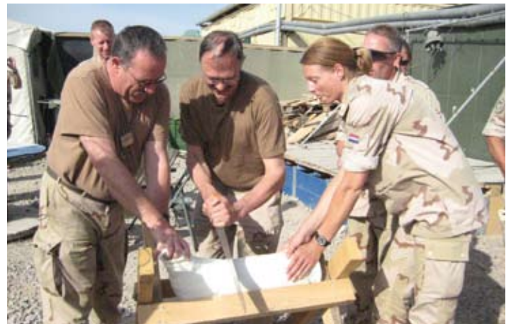
De uitzending chirurgisch in 2-en zagen

Soms moeten we roeien met de riemen die we hebben. Ongeveer twee jaar geleden heb ik in Kandahar bij een Afghaan een mergpen in zijn linker bovenbeen gezet. Hij had nu last van de onderste schroeven, waarschijnlijk van een pees die er overheen schoof. Aangezien hier het officiële instrumentarium niet aanwezig is wilden we hem aan het Kandhar Airfield Hospital aanbieden, maar dat gaf veel problemen. Wij hebben hem toen aangeboden om de schroeven met instrumenten van de technische dienst te verwijderen. Daarmede ging hij akkoord. Samen met de technicus hebben we een aantal instrumenten uitgezocht en laten steriliseren. De volgende dag konden we met succes de schroeven verwijderen. De patiënt is, dankzij deze gezamenlijke inspanning, van zijn klachten af.