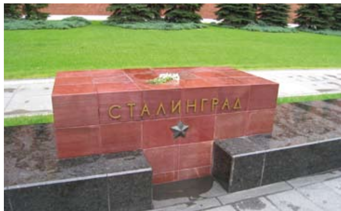
Stalingrad

gespeeld door het fanfarekorps.” Zo beschreef Vasili Grossman in zijn indrukwekkende epos ‘Leven en lot’ het begin van het beslissende tegenoffensief van het Rode Leger tegen de Duitse belagers van Stalingrad. De twee hamers troffen elkaar op het beheersende terreindeel ‘heuvel 102’, zoals Mamajev Kurgan in legertermen heette. De tanks van 102 tankbrigade en de voorhoede van het 62e leger maakten er op 26 januari 1943 contact. Tegenwoordig staat op deze heuvel een van de grootste oorlogsmonumenten ter wereld: Het Moederland roept!