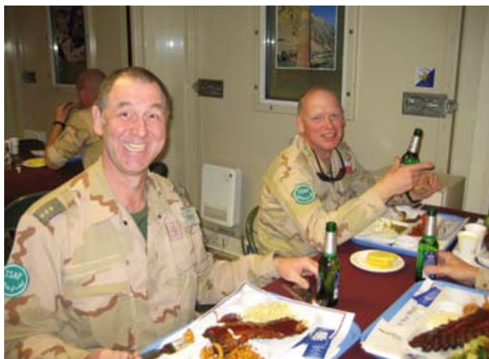
Aan de spare-ribs met alcoholvrij bier

Dan nog een paar humorvolle momenten: gelukkig hebben we die hier veel, ondanks het sombere deel dat ik hiervoor heb geschreven. Collega A zegt oprecht tegen collega B (beiden zijn man). "Goh, wat ruik je lekker. Welke aftershave gebruik je?" B: "Dank je, weet je het zeker? Ik heb vandaag geheim archief verbrand en ik stink volgens mij naar rook." A: "Ik denk dat ik al te lang in een uitzendgebied zit... grmpffill."