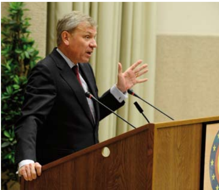
NAVO Secretaris-Generaal Jaap de Hoop Scheffer

Op 18 mei 2009 is door CIOR en de KVNRO een bijeenkomst gehouden op het NAVO-hoofdkwartier te Brussel. Voor deze bijeenkomst waren alle reserveofficieren van de landen die bij CIOR aangesloten zijn uitgenodigd. Onder de aanwezigen waren ook ruim 100 Nederlandse reserveofficieren en alleen hierom al kan de bijeenkomst als een succes worden gezien. Op de bijeenkomst was NAVO secretaris-generaal Jaap de Hoop Scheffer als keynote speaker uitgenodigd, een uitnodiging waaraan hij graag gevolg heeft gegeven. Hieronder vindt u de Engelse tekst van zijn toespraak.