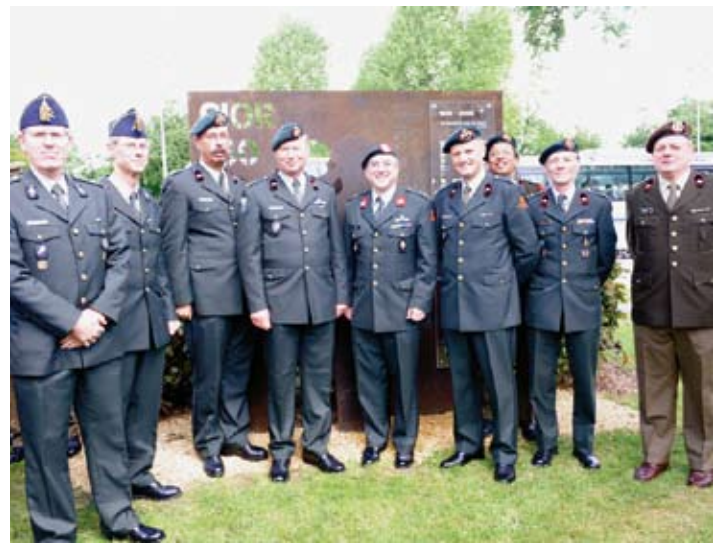
Alle aanwezige reserveofficieren van de artillerie voor het monument

I have highlighted four examples for you where I believe the trends from the recent past can offer valuable pointers for the immediate future. There are many others I could have mentioned – but I do not wish to monopolise the talking this afternoon. Instead, I feel it would be far more valuable to give you the opportunity to ask me questions. So before I open up the floor to you, let me conclude by repeating what I said earlier. Quite simply, your dedication and commitment as reservists, make your countries' armed forces more effective. And this in turn, makes NATO more successful.