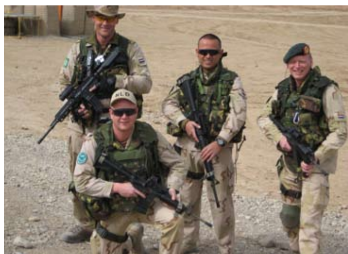
Nee, niet de Dirty Dozen maar uw secretaris met collega's

Vanochtend zijn we naar de schietbaan gegaan voor onderhoud van onze schietvaardigheid. Wat daar gebeurde leek in de verste verte niet op datgene wat ik ooit in Nederland heb geleerd. Niet op gebied van schietvaardigheid en ook niet later op gebied van wapenonderhoud. Voor de tweede keer in mijn carrière van 27 jaar bij de KL heb ik aan gevechtsschieten gedaan. De eerste keer was ergens in de jaren 80 met een Uzi. Nu had ik een pistool en een Diemaco bij me. De oefeningen hielden in dat we met vuur en beweging een soort haasje over voorwaarts en daarna weer achterwaarts deden. Dat lijkt makkelijk, de een loopt een paar stappen, de ander geeft hem dekkingsvuur. Naar zo eenvoudig is het niet. Allereerst hadden we uiteraard onze scherfvesten en opsvesten aan en onze helmen op. Verder moesten we telkens een tweetal schoten op een schijf afgeven, de knielende schiethouding aannemen en nog eens twee schoten afgeven. Dat door de knieën gaan was geen probleem, maar na een anderhalve uur was mijn linkerbovenbeen totaal verzuurd. Telkens nadat we knielend schoten hadden afgegeven, moesten we weer opstaan (met een geweer in de aanslag) en verder lopen. Nu, vanavond, voelt dat been nog steeds totaal verzuurd aan. Je wordt ouder, papa... Aan het einde van de schietochtend was de kleding aan mijn bovenlijf totaal doorweekt van het zweet, terwijl de temperatuur slechts 14 graden was vandaag. Heftig, maar ook realistisch.