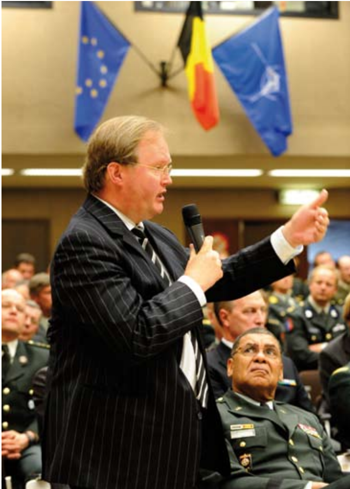
KVNRO-lid Kol Hans van Baalen discussieert met NAVO SG Jaap de Hoop Scheffer

on in Iraq; Partner nations have deployed alongside Allies on Operation Active Endeavour; air policing is being successfully conducted on behalf of several Allied nations; a massive humanitarian operation was conducted in support of Pakistan following the earthquake in 2005; our forces in Kosovo have continued to keep the peace through some very challenging times, including through the period of self-declared independence last year; we have trained and provided logistic and airlift support to the African Union; and we are now conducting counter-piracy operations off the Horn of Africa.