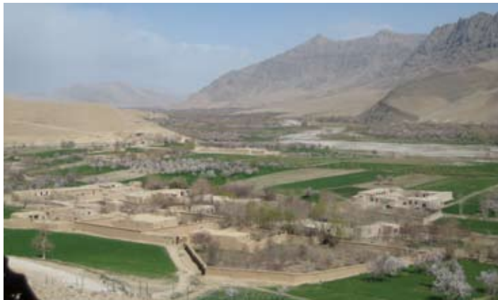
Uitzicht vanuit PB Qudus naar de Baluchi-vallei

werden we rondgeleid door de post. Op een of andere manier bekwam me het gevoel dat roofridders vroeger ook op een dergelijke wijze een post als deze zouden hebben aangelegd. Er was een geweldig uitzicht over beide gebieden en niemand die van de TK Bowl naar de Baluchi wil of andersom, kan dit doen zonder dat het vanuit deze post wordt waargenomen. Het was alleen jammer dat vooral wij de aandacht kregen van onze ANA's. Maar ja, laten we eerlijk zijn, een van onze collega's was vrouw, lang, blond haar, blauwe ogen en net als de rest van ons, gewapend met pistool en geweer. Wij zijn er inmiddels aan gewend, maar hier is dat niet zo gewoon. Elke ANA-soldaat wilde met haar op de foto en dat liet ze gelaten over zich heen komen. Ik had bewondering voor haar geduld en het feit dat ze geen moment protesteerde en bleef glimlachen. Maar goed, de mannen hebben een mooie foto en een mooi barverhaal... euh, theehuisverhaal voor de komende 20 jaar of zo. Een verhaal dat waarschijnlijk bij elke vertelling weer fraaier zal worden.