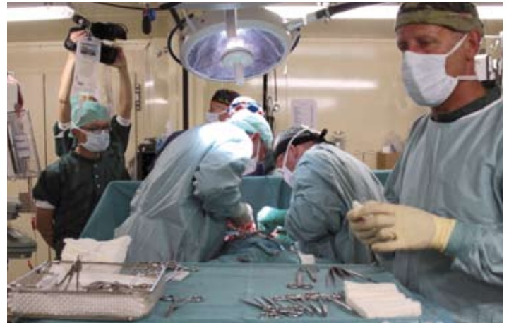
Op de operatiekamer

De laatste tijd hebben we ook kinderen gehad met o.a. breuken van het onderste deel van de bovenarm (supracondylaire humerus fractuur). Het waren kinderen die uit bommen waren gevallen en bij één kind was er een koe op gaan staan. Ondertussen hebben ook al weer Afghaanse militairen gehad met verwondingen ten gevolge van IED's (bermbommen). De patiënten komen in golven. Het ene moment is het rustig en dan wordt er weer een groepje gewonden binnen gebracht.