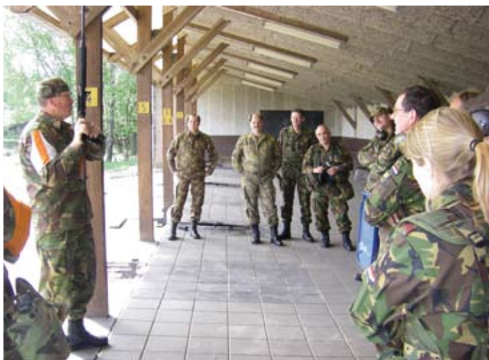
Briefing op de schietbaan

Ongeveer de helft van de schutters was van de KVNRO en de andere helft van de AVRМ. Er werd niet in teams geschoten, maar individueel. Geen bekens en medailles voor de besten onder de schutters, maar een ingegraveerde eervolle vermelding van de winnaars in het bord met een overlangs doorgezaagd pistool Glock of in een overlangs gehalveerd geweer Diemaco. Deze houten schildborden met de winnaars van de achtereenvolgende jaren hangen boven de bar in de kantine van de Legerplaats Harskamp ofwel de Generaal Winkelmankazerne.