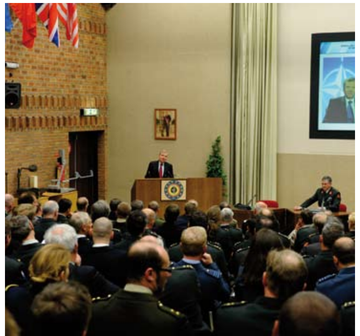
De belangstelling was overweldigend

I believe as well that today that role is even more important. We go through the worst financial crisis this world has ever known. That crisis is bound to have an effect on the armed forces of today. Governments looking for cuts to be made will certainly look at the reservists for an easy solution to cut costs. Other governments will on the contrary propose to cut down the number of regular forces and place a bigger emphasis on the use of reservists. In both cases you will be affected by those measures.