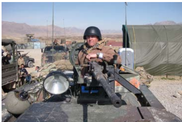
Een van onze POLAD's die zo uit Kelly's Hero's is weggelopen.

loton). Aan mij de schone taak om ze te helpen daar waar ze tegen de eigenaardigheden van het militaire bedrijf aanlopen. Verder is het aansturen van het team persoonsbeveiligers een van mijn taken. Kortom, inmiddels komen ze met allerlei probleempjes en problemen bij mij. Vaak kan ik ze met een korte uitleg doorverwijzen naar de juiste persoon en verdwijnt het probleem als sneeuw voor de zon. Is het spannend? Nee, maar wel nuttig omdat je daardoor smeerolie bent in de organisatie.