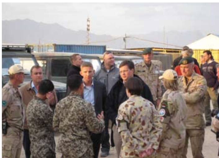
Premier en Staatssecretaris in gesprek met personeel van de ROLE2

Kortom, ook dit was weer een hoogtepuntje om op teug te kijken en belangrijker, er was ook weer een mooie foto toe te voegen aan het fotoalbum. Jammer alleen dat ik er met bril op sta, want net die dag had ik last van mijn ogen en kon ik mijn lenzen niet in. De eerste keer in 4 weken...Ijdel? Wie? Ik? Grrrrmmppppfff. Een van onze Australische collega's sloot de evaluatie later af met: 'So I have seen Harry Potter, but what's he doing in Afghanistan..?'