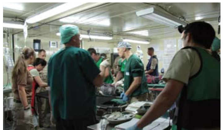
Op de operatiekamer

Defensie heeft de adaptatie georganiseerd om te voorkomen dat men vanuit het leefklimaat in het uitzendgebied direct in de westerse samenleving stapt. Het is gebleken dat dit soms problemen op kan leveren. Tevens zijn deze dagen voor het voeren van debriefingsgesprekken en om te kijken of er tekenen van posttraumatisch stresssyndroom aanwezig zijn. De verwachting is dat wij vrijdag 5/6 in Nederland zullen aankomen.