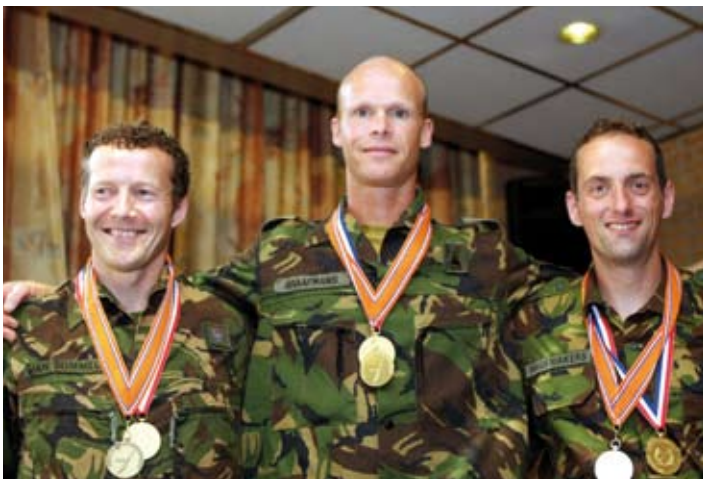
Drie van de zeven personen die ooit vier keer het 5-kampkruis haalden.