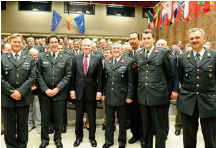
NAVO SG met het organiserende committee van het CIOR presidency.

this has led to what we call the 'Comprehensive Approach', where NATO prepares, plans and operates in a coordinated manner with other international actors. Although the primary organisations NATO works alongside on operations are the United Nations and the European Union, we also have increasing contacts with a broad variety of Non Government Organisations - the International Commission of the Red Cross is a good example, but there are many others. For NATO, this heralds a sea change in the way we think and organise ourselves. We have to get used to the fact that we are just one piece of a much broader puzzle. And we also have to get used to working with organisations that follow their own philosophy and abide by their own rules.