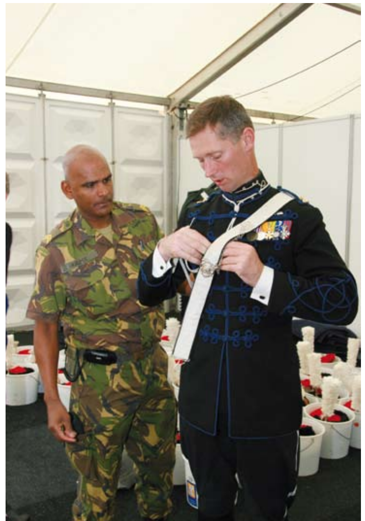
Het kleden in het ceremonieel tenue. Let op de kolbakken in de emmers op de achtergrond.

“Ik begin in beide pelotons met een sterkte van ongeveer 32 ruiters. Aan de feitelijke dag doen echter pelotons van 25 ruiters mee. In de opwerkcyclus vallen er dus altijd 6 à 7 per peloton af. Dat is geen schande, maar het kan natuurlijk altijd dat iemand zich blesseert, dat een combinatie van paard en ruiter gewoon even niet helemaal werkt of een andere reden. Toch blijven de afvallers gewoon beschikbaar tot aan het einde van de rijtoer. Zo heb ik altijd een ruiter in vol ornaat gereed staan, dus met paard en in ceremonieel tenue, voor het geval dat een van de ruiters onverhoopt vlak voor of zelfs tijdens de rit uitvalt. Dan kunnen we hem bliksemsnel vervangen en niemand die het verschil ziet. Dat lijkt misschien niet leuk, maar het is wel een belangrijke taak, want alles staat en valt bij een vlekkeloze uitvoering”.