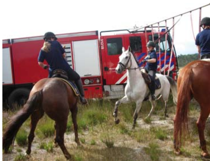
De amazones van de bereden politie laten hun vaardigheden zien.