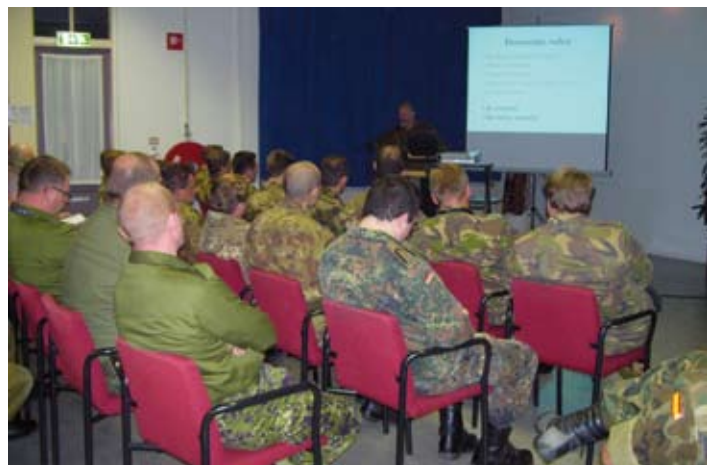
De briefing voor de deelnemers.

Kort voor de afsluiting van het schieten bracht genm Van den Broek, Plaatsvervangend Commandant Landstrijdkrachten, tevens Inspecteur Reserve Personeel Landstrijdkrachten een be-