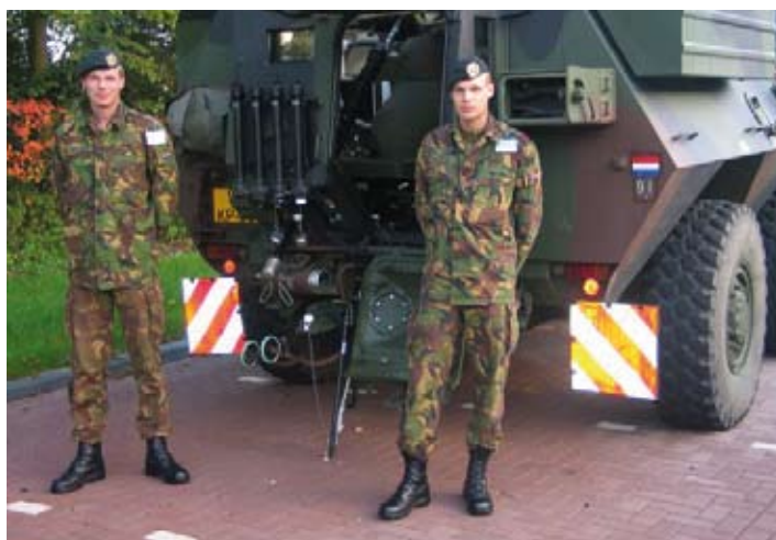
Spurfuchs met bemanning. Een welkome aanvulling op de capaciteit van brandweerkorpsen.

Het project, dat onder leiding van kol G.J. Ludden volgde, leverde de formatie op van dienstploegen voor de opsrooms van de