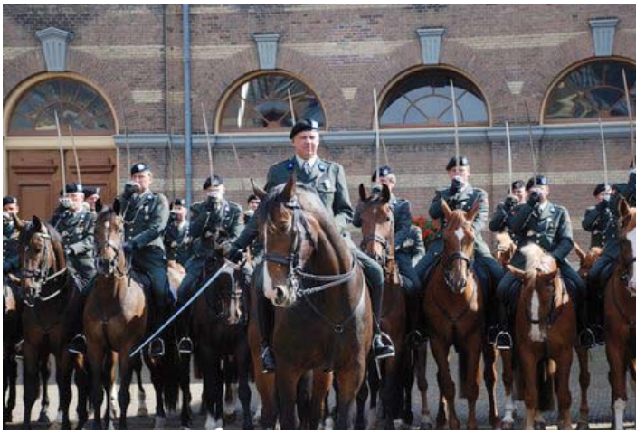
Beëdiging op het binnenhof.

rietraditie, namelijk dat de trompetters zich qua uitmonstering onderscheiden van de overige huzaren door in zogenaamde contrakleuren te rijden.”