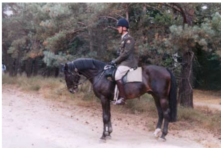
Een cavalierist in zijn element.

Zaterdag, 29 augustus vormde de schitterende omgeving van 't Harde weer het decor voor de jaarlijkse Militaire Prestatietocht te Paard. Als uitvalsbasis voor de 8e editie van deze kaartlees tocht was dit keer gekozen voor de legerplaats bij Oldebroek. Een recordaantal van 82 deelnemers, waaronder deze keer ook vele collega's van de politie, had ingeschreven voor deze prestatietocht waarbij, naast het uitpuzzelen van de juiste route, een beroep wordt gedaan op vaardigheden als boogschieten, pistoolschieten en ringsteken. Ook worden paarden en ruiters getest op hun moed en behendigheid tijdens een springparcours en het overwinnen van, voor sommige rijdieren, angstaanjagende hindernissen.