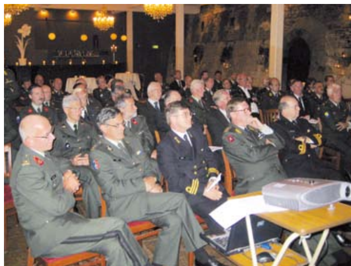
Leden en gasten luisteren aandachtig naar de voorzitter.

Uit deze paar voorbeelden ziet u dat wij defensie veel te bieden hebben als bijdrage aan de oplossing voor de huidige personeelsproblematiek. Dit is niet nieuw; Al meer dan 90 jaar is het de taak van de KVNRO om defensie te ondersteunen.