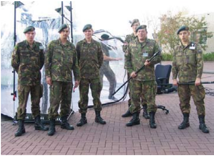
NBC-ontsmettingscapaciteit van de genie.

hoe de aansturing en de informatievoorziening konden worden georganiseerd en hoe de civiel-militaire samenwerking op het gebied van kennisopbouw en oefenen konden worden ingevuld. De uitkomsten werden bezegeld in het ondertekenen van het convenant 'Intensivering Civiel-Militaire Samenwerking' (ICMS). Als uitvloeisel hiervan verscheen de catalogus met het overzicht van gegarandeerde capaciteiten.