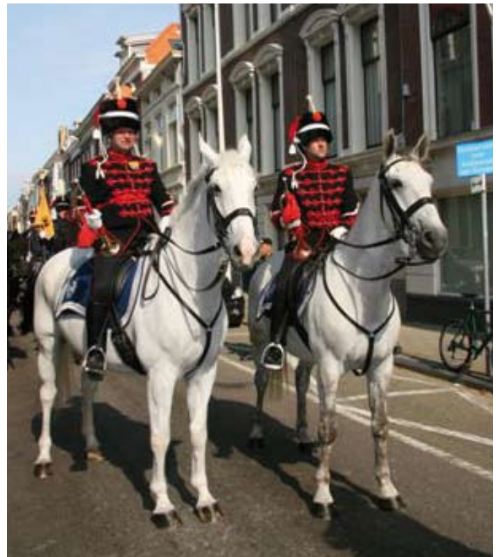
De trompetters van het Regiment Huzaren Prins Alexander

"Het is natuurlijk niet leuk voor een cavalerist om te zien dat de standaard van één van de regimenten huzaren wordt opgelegd." Hij vindt deze omschrijving een eufemisme en er klinkt enige weemoed in zijn stem als we het hebben over de rijke traditie van de Rode Huzaren. "Toch is het een logisch gevolg van de ontwikkeling die de krijgsmacht doorgaat. We zijn in de afrondende fase van de overgang van een kader-militie leger naar een expeditionaire krijgsmacht bestaande uit vrijwilligers. Hierbij is het onvermijdelijk dat er keuzes gemaakt worden, ook daar waar het opheffen van onderdelen betreft. Er zijn nog maar drie cavaleriebataljons over en het zou een verkeerde zet zijn om de tradities van het vierde regiment op een kunstmatige manier in stand te houden." Er klinkt veel realisme door in deze constatering. Maar Kampen vervolgt dan weer meer een bevlogenheid die hem typeert: "Maar de Trompetters van het Escorte zullen met hun rode attila's voor altijd herinneren aan de Rode Huzaren. Het past ook in een andere cavale-