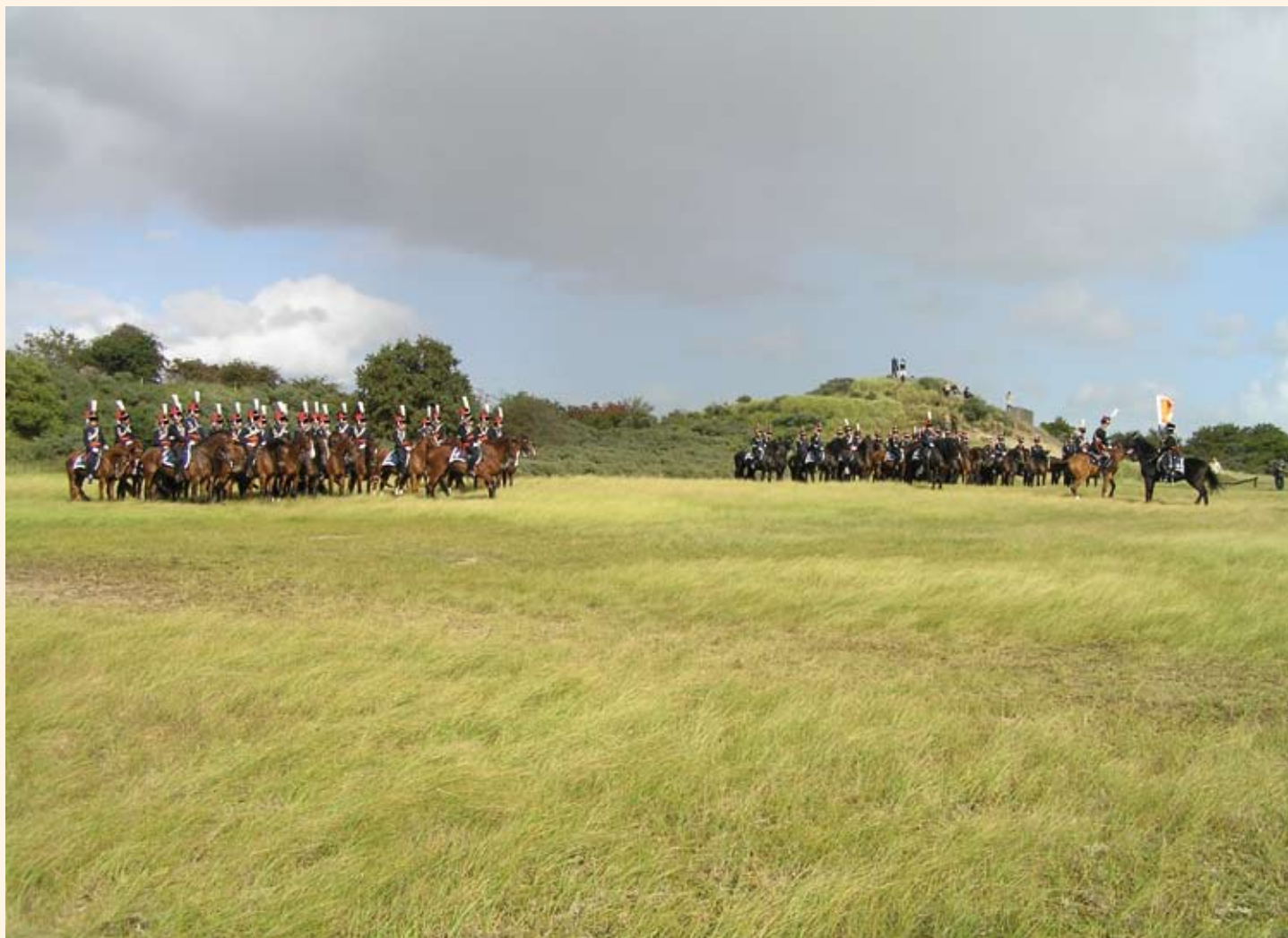
Overdracht van het commando van het Cavalerie Ere-Escorte na afloop van Prinsjesdag 2007.