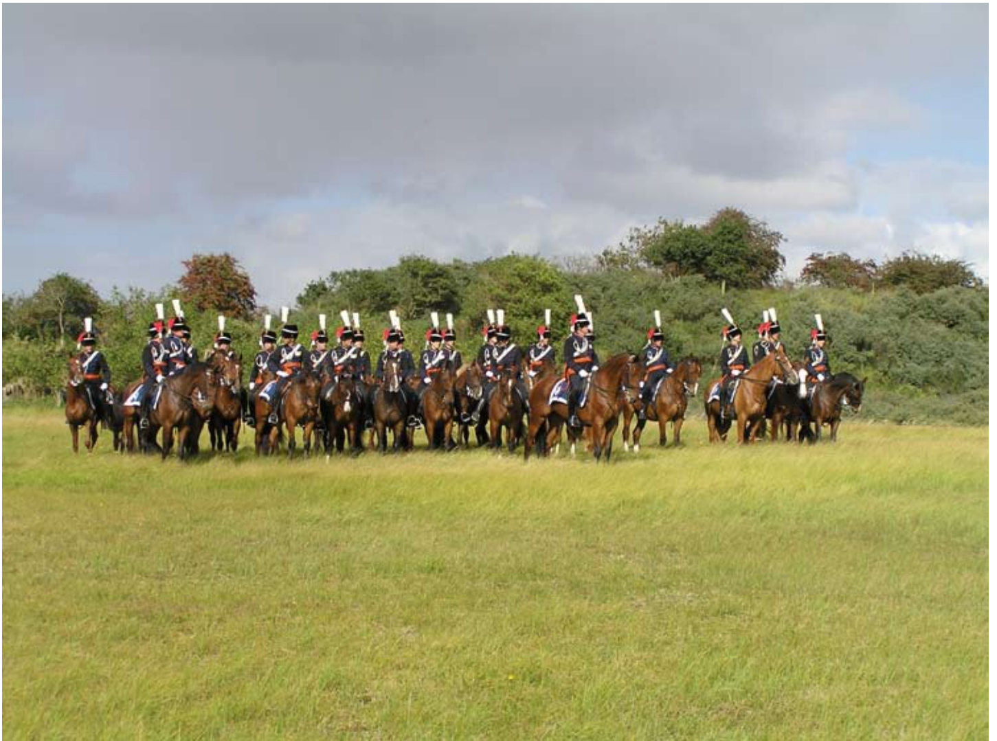
Het eerste peloton van het Cavalerie Ere-Escorte

om dit van hem over te nemen. De commando overdracht vond plaats op Prinsjesdag 2007, aan het einde van de dag." Hierdoor was Prinsjesdag 2008 de eerste keer dat Kampen met zijn escorte Hare Majesteit mocht begeleiden. "Het commando over het Cavalerie Ere-Escorte geeft mij een unieke kans om drie voor mij belangrijke zaken te combineren: Het zichtbaar laten zijn van de krijgsmacht, het beoefenen van de ruitersport en het in stand houden van een stukje militaire traditie."