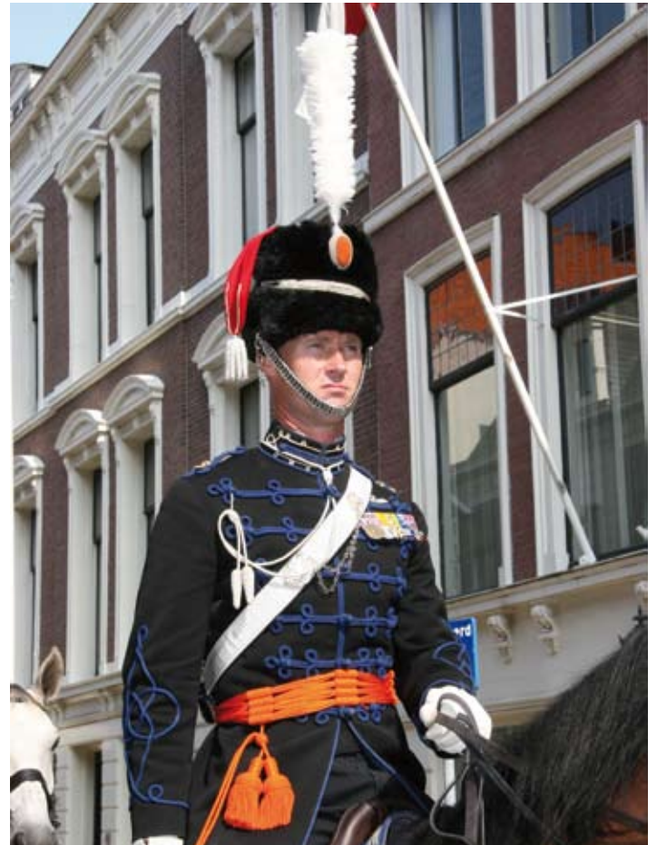
Nu gaat het gebeuren!

Maar daar blijft voor Kampen niet bij; het Cavalerie Ere-Escorte is ondergebracht in een particuliere stichting. Door het uitgebreide netwerk van de reservisten worden er mogelijkheden aangeboden, die via defensie niet toegankelijk zijn. Denk hierbij maar aan de donateurs die de stichting kent. Deze bieden ondersteuning in de vorm van het beschikbaar stellen van een paard, uniformen of gewoon een jaarlijkse geldelijke bijdrage