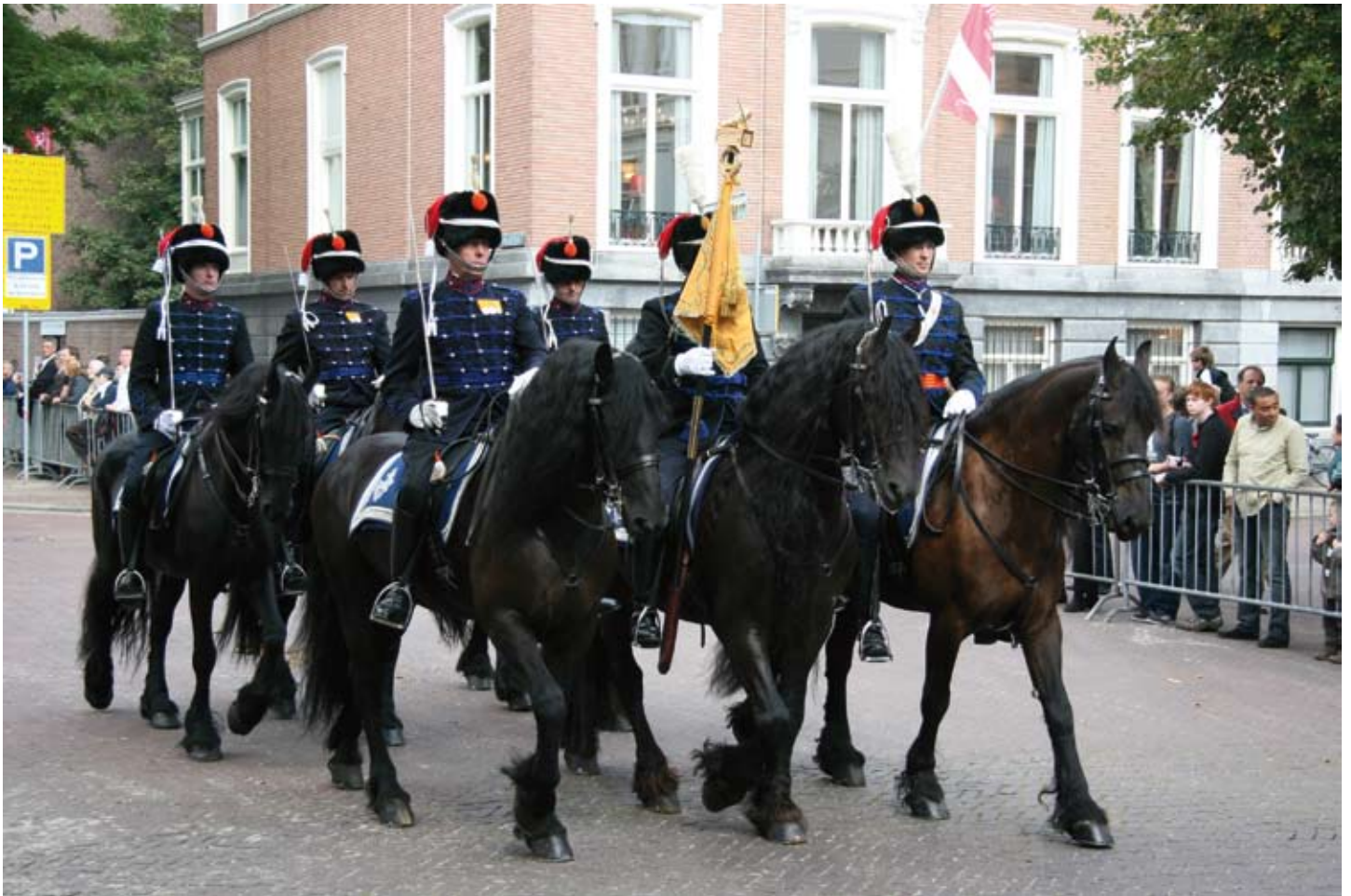
De standaardwacht van het Regiment Huzaren van Boreel.