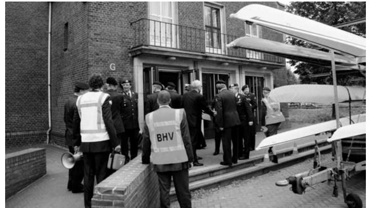
Het aspect veiligheid werd ook tijdens de Algemene Vergadering in de praktijk gebracht

Hoogland. Onze gedachten gingen uit naar de nabestaanden en collega's. We spreken de wens uit dat zij de kracht vinden om dit zware verlies te kunnen dragen.