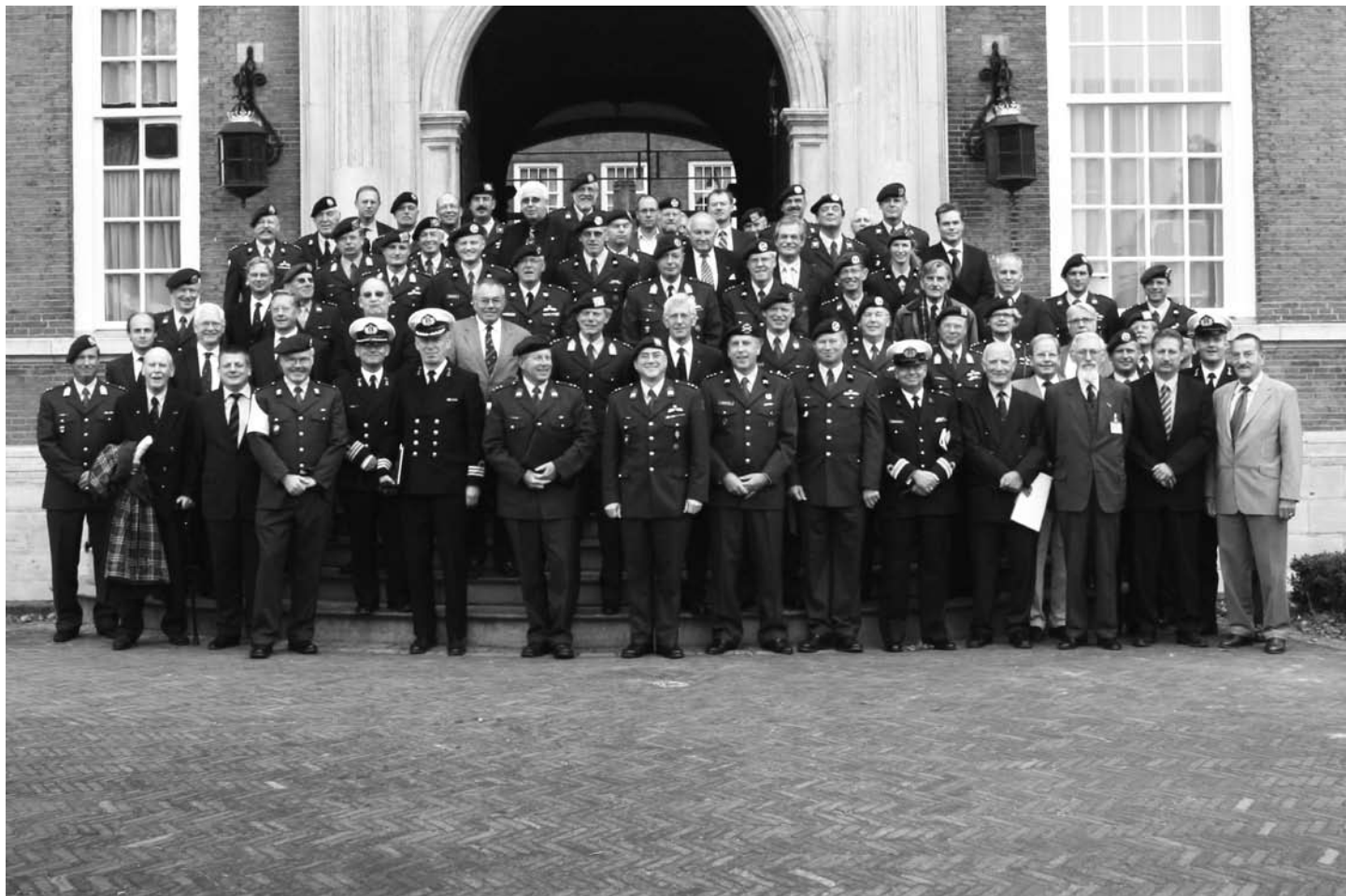
De deelnemers aan de 90 ste Algemene Vergadering van de KVRO op 22 september 2007 te Breda.