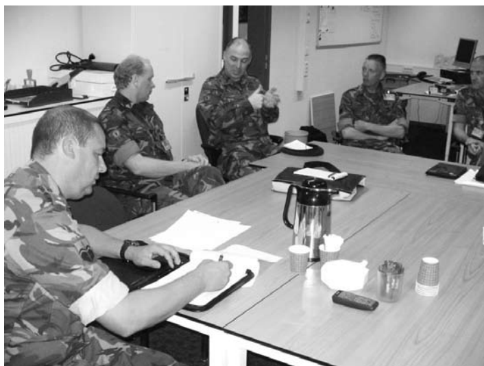
Evaluatie is een essentieel onderdeel bij een oefening.

Defensie had verschillende middelen achter de hand. Een deel van deze middelen was reeds in de regio aanwezig (ziekenauto-eenheid) of werd vanaf de vredeslocatie op de Veluwe naar het oefengebied gedirigeerd (NBC-verkennings- en ontsmettingseenheid). Het actiecentrum onderhield contact met de buitenwereld door middel van telefoon, internet, televisie en GSM. Na enig indribbelen, het "team" werkte voor het eerst met elkaar samen, werd snel een modus gevonden. De problemen die door de dienstploeg getackeld moesten worden waren het creëren van situationeel awareness voor zichzelf en voor de militairen die onder het RMC vielen. Hierbij speelde meerdere malen het fenomeen "fog of war" ons parten. Maar door vervolgens alle informatiekkanalen goed te gebruiken kwam snel inzicht in de feitelijke situatie en kon de juiste beslissing worden genomen.