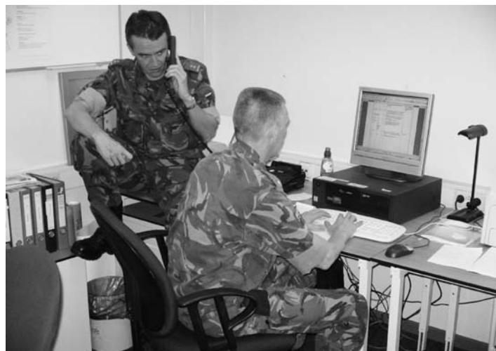
Het actiecentrum van RMC-West in bedrijf.

Behalve ministeries, de gemeente Rotterdam en operationele diensten deden ook de provincie Zuid-Holland en organisaties op het gebied van bewaking, inlichtingen en communicatie aan de oefening mee. Aan Defensie werd tijdens de oefening bijstand gevraagd in de vorm van drie ziekenauto's. Deze auto's van het type MB verzorgden de afvoer van gewonden van de aanvaring. Voyager is te vergelijken met de terreuroefening Bonfire, die begin april 2005 in en rond de Amsterdam Arena werd gehouden. Eens in de twee jaar is er zo'n grootschalige