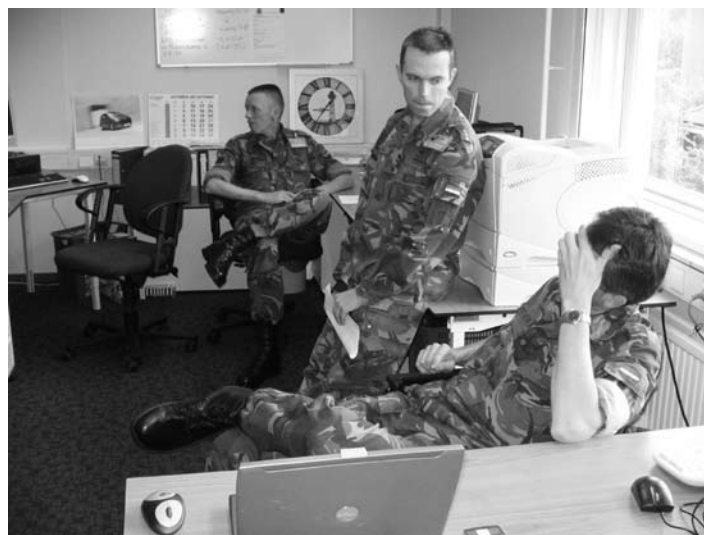
We blijven altijd nadenken en communiceren.

Wat opviel is dat de werkwijze binnen het nationale resort in een verstedelijkt gebied ietwat afwijkt van de werkwijze uit het verleden. Zo waren er geen stafkaarten met achtcijfer coördinaten, maar moesten we ons verlaten op hulpmiddelen als routeplanners en de aloude Tom-Tom om eenheden op het ontmoetingspunt te krijgen. Verder misten wij het gekraak van