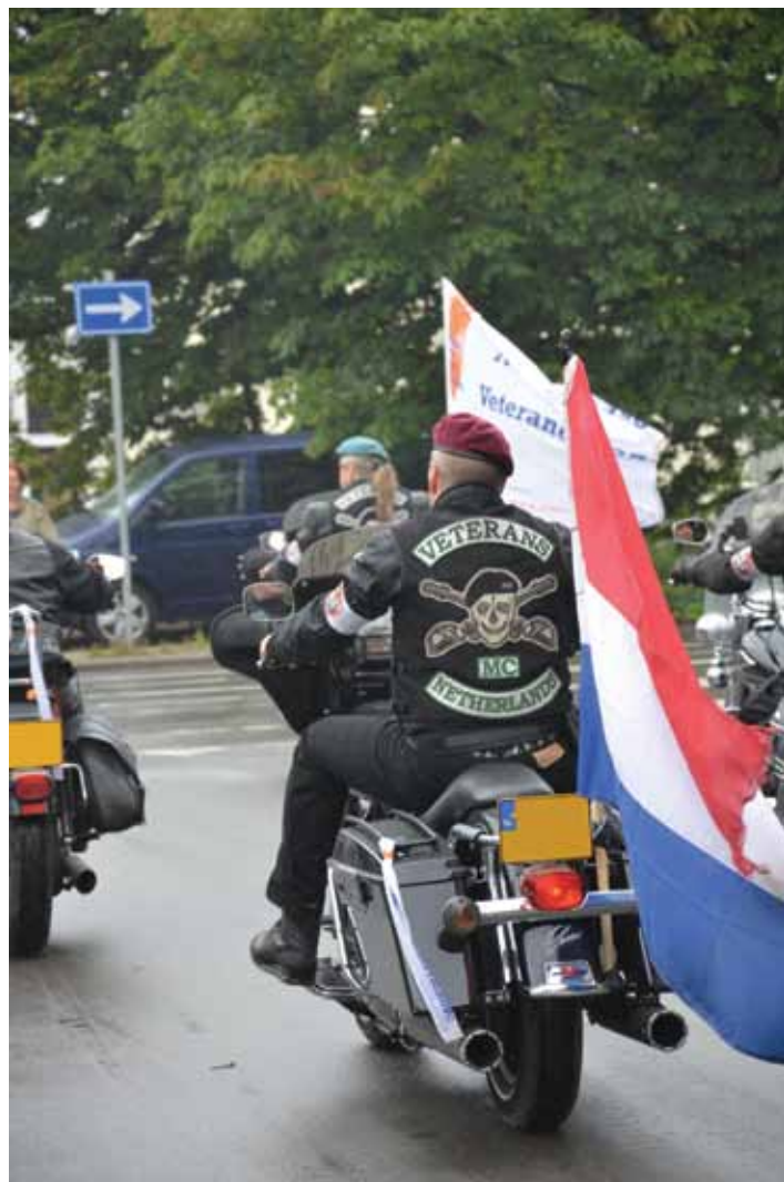
De Prins van Oranje was verheugd met de motorrijders in het defilé

heven is evenwel dat de club rond de eeuwwisseling de full colour patch bemachtigde. Op de rug prijken vanaf nu de colours van de Veterans MC, de beeltenis van een grijnzend, met baret getooid doodshoofd.